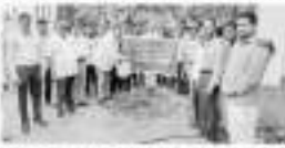
आनंद महाविद्यालयाच्या पर्यावरण विभागाच्या वन परिक्षेत्र अधिकारी असून साबळे; आनंद महाविद्यालयामध्ये वृक्षारोपण

सर्वात सुखी : पुर्णा सुकरी आनंद महाविद्यालय पर्यावरण विभाग (वन विभाग) वन परिक्षेत्र अधिकारी असून साबळे; आनंद महाविद्यालयामध्ये वृक्षारोपण कार्यक्रम आयोजित करण्यात आला. या कार्यक्रमात पर्यावरण विभाग, पुर्णा व वन विभाग, साबळे यांच्या सहकार्याने वृक्षारोपण करण्यात आले. या कार्यक्रमात पर्यावरण विभाग, पुर्णा व वन विभाग, साबळे यांच्या सहकार्याने वृक्षारोपण करण्यात आले.