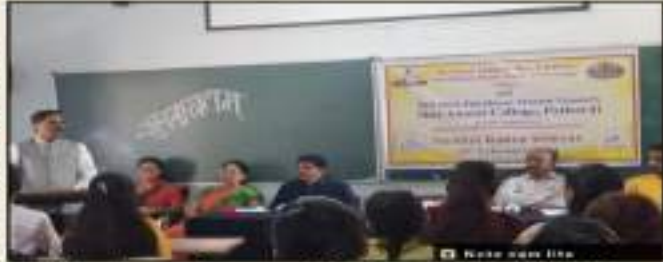
श्री आनंद महाविद्यालयात" निर्भय कन्या अभियान शिबिर "संपन्न.