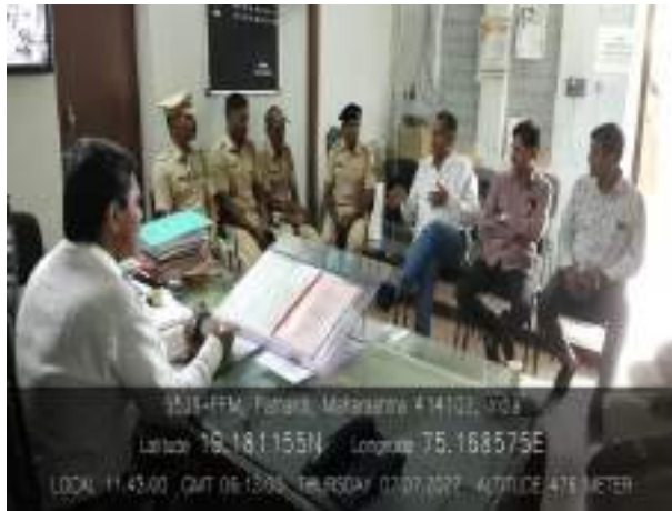
15J1-FFM, Patard, Maharashtra 414102, India Latitude: 19.181155N Longitude: 75.168575E LOCAL 11:43:00 GMT 06:12:03 THURSDAY 07/07/2022 ALTITUDE 476 METER