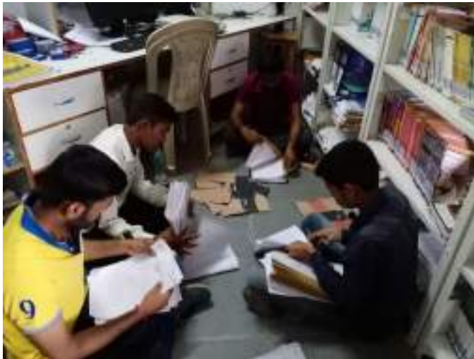
Photo1: Students working in library

The students enrolled under the scheme are given the types of work such as technical work, field work and library work etc. Total Number of Students enrolled under this Scheme for academic year 2022-23 was five. Remuneration for this scheme is Rs 45/- per hour. The five students were enrolled during this academic year. Total expenditure incurred on Earn and Learn scheme was 10665/- out of that SPPU, Pune provided with financial aid of Rs. 9598/-. Total nine students were benefited by the earn and learn scheme.