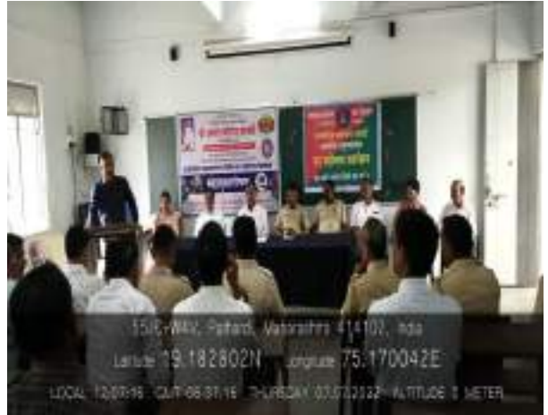
15E-WXV, Patard, Maharashtra 414102, India Latitude: 19.182802N Longitude: 75.170042E LOCAL 12:07:18 GMT 06:09:16 THURSDAY 07/07/2022 ALTITUDE 0 METER