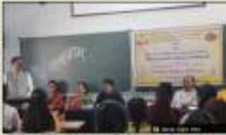
श्री आनंद महाविद्यालयात 'निर्भय कन्या अभियान शिबिर' 'संपन्न.