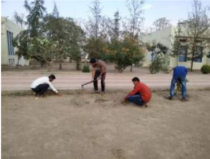
Photo2: Students working in field